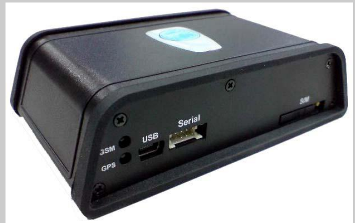
El producto puede variar respecto a la fotografía